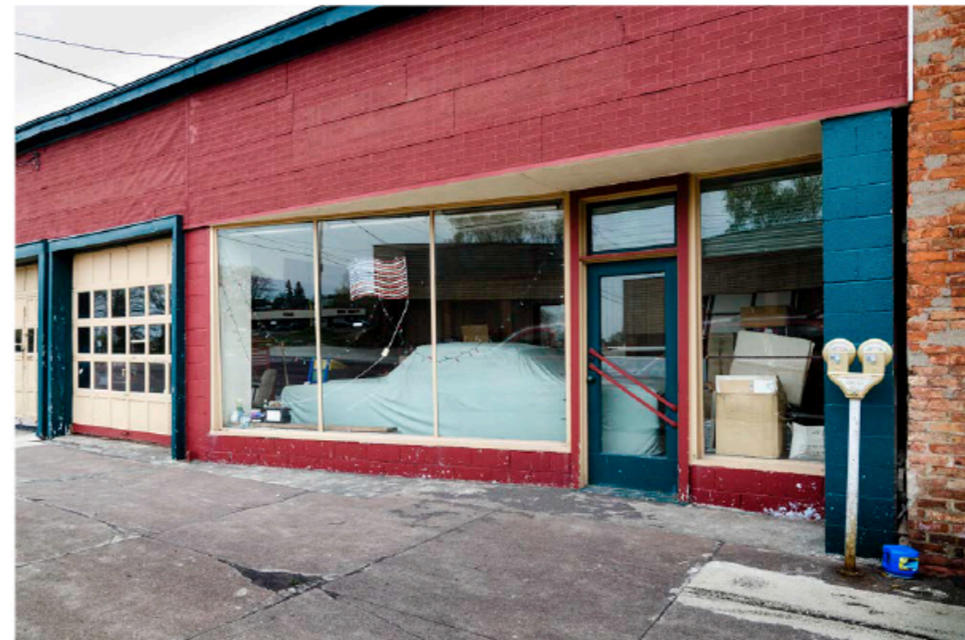
© Hans U. Alder, de la 3 ème série Coney Island (Brooklyn, NY), 2011, tirage pigmentaire. Courtesy Neubad Galerie