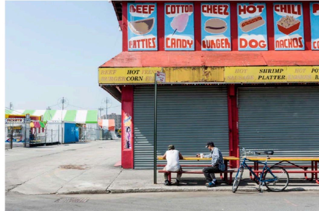
© Hans U. Alder, de la 3 ème série Coney Island (Brooklyn, NY), 2011, tirage pigmentaire. Courtesy Neubad Galerie