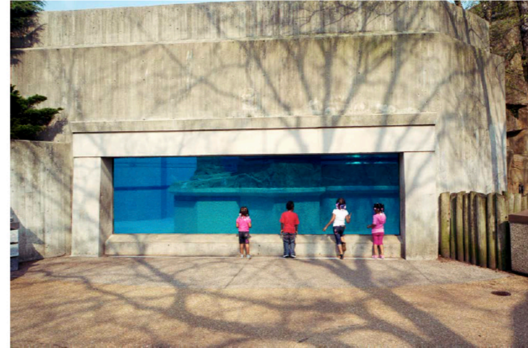
© Ueli Alder, Lincoln Park Zoo, Chicago, Illinois, 2011, tirage pigmentaire sur papier fait main, 29x44 cm. Courtesy Neubad Galerie