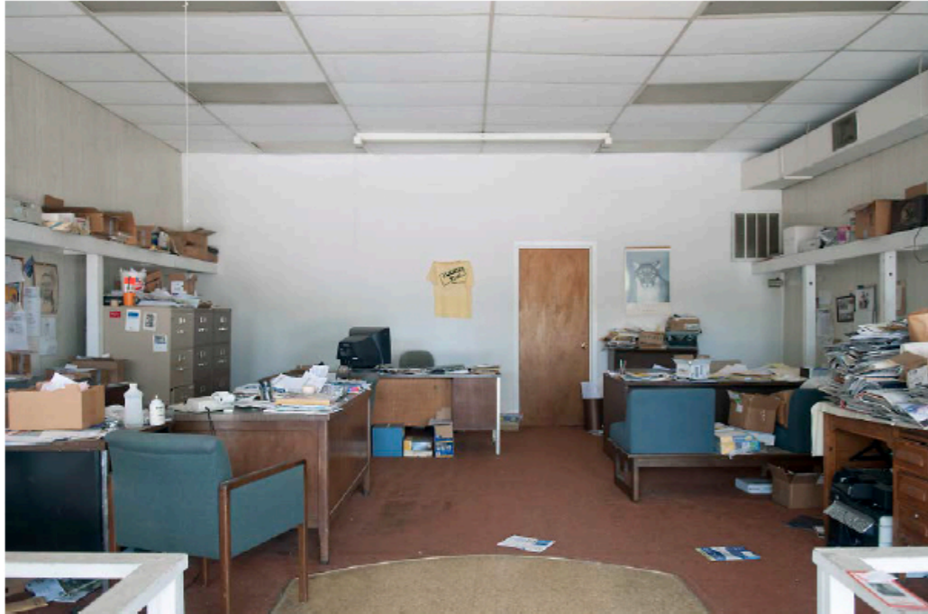
© Sabine Troendle, In Business, 2015, tiré du livre Texas Reliable News, Zurich, autoédité, 2015, 300 ex. Courtesy Neubad Galerie